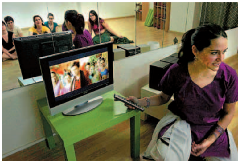
Una de las clases de danza en el centro de terapias Anandí

Primero llegarán los chinos y luego los indios. Los primeros expertos en manufacturas e industrias y los segundos aportarán su cada día más reconocido conocimiento científico y tecnológico basado en el elevado número de ingenieros de diversas ramas. Tanto es así que se calcula que en el 2010 el 30% de las transacciones bancarias estadounidenses se gestionarán a distancia desde India. Antes de que llegue esa fecha, y para irse adaptando, habrá que acostumbrarse a ver muchas de las 900 películas que ruedan al año en Bollywood –el glamoroso espejo donde se mira y en el