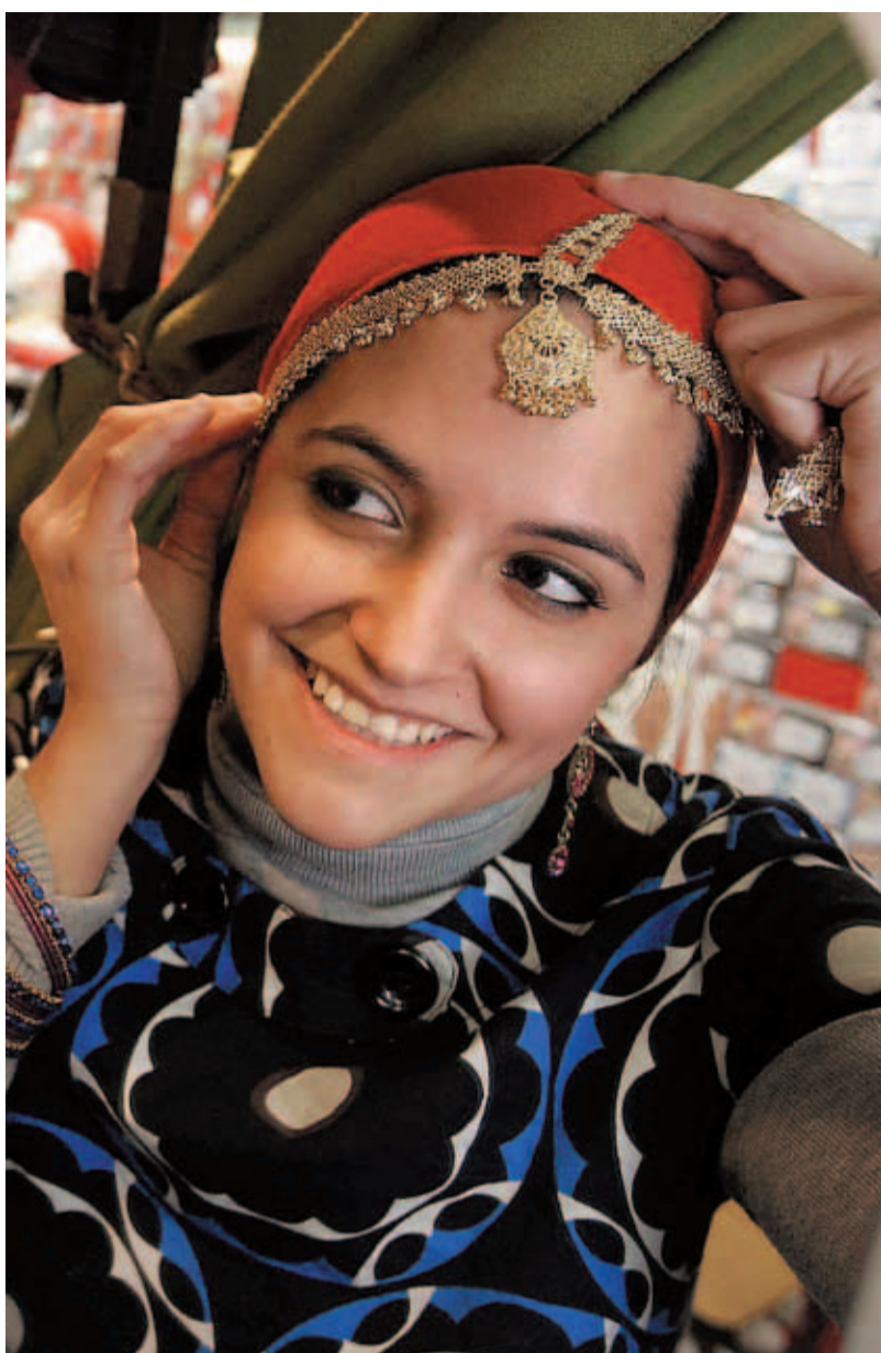
de boda en Nagma