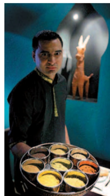
El surtido de especias en Bembí

ro, mientras se prueba tocados y coloca abalorios, reconociendo etnias y cantando temas de películas. Cuando cuenta que conoce a Shahrukh Khan, la mayor estrella del cine indio y que ha estado en su palacio, las chicas se mueren de envidia. Las estrellas Bollywood están en todas las tiendas, ya sean locutorios o de alquiler y venta de vídeos –donde nos vetan la entrada–, hasta peluquerías o cualquier otro espacio. La verdad es que las hermosas Priyanka Chopra y Aishwariya Ray están incluso en los sobres que envuelven pasadores, bisuterías y pinzas para el pelo. El aire retro de las fotos, un tanto descoloridas, envuelven una tranquila, aunque oscura, Rambla del Raval, donde abundan restaurantes y carnicerías, aunque éstas pertenecen a los pakistaníes. En Casa Raval nos aseguran la autenticidad de sus preparados. “Somos únicos”, dicen, mientras unos apacibles comensales, inspirados en su té, ni se fijan en los deslumbrantes y coloristas estampados plastificados del mantel. Casi al lado, el Baba nos seduce con sus paredes, con espejos trompe l'oeil y sus marquesinas impolutas y sorprendentes en el espacio. Allí nos dan una clase magistral entre guindillas de todo tipo y especias envasadas llegadas desde Bombay. En la parte de la Rambla que cierra Hospital, está