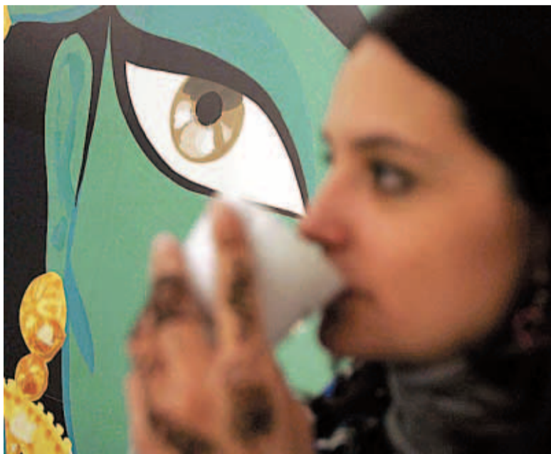
Parte del mural de Jordi Labanda para el Sandwich & Friends