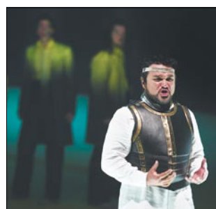
Ramón Vargas, en una actuación en Austria.

Coproducida por el Teatro Real de Madrid, la Ópera de París y la Scala de Milán, la primera ópera de ma-