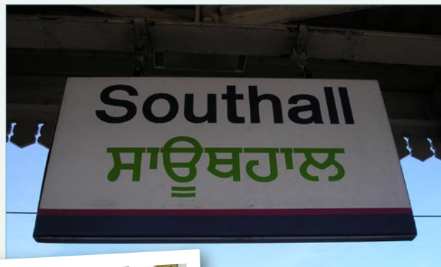
Southall, uno de los barrios indios de Londres.

Decenas de tiendas con música Bollywood a todo volumen compiten con el british bhangra . Con este nombre se define a los enérgicos ritmos que han nacido gracias a la segunda generación de inmigrantes indios, que han tomado el bhangra —ritmos tradicionales del norte de India— como punto de partida, y lo han fusionado con otros estilos, como la música negra o el pop. Como es